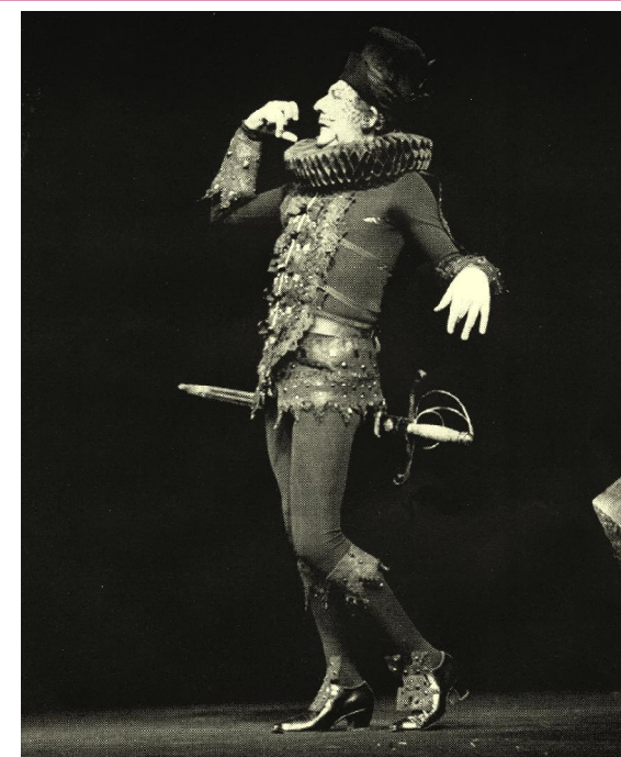
Corneille, L'illusion comique , Matamore par G. Wilson