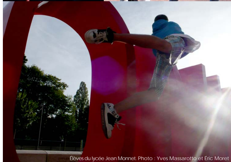
Élèves du lycée Jean Monnet.